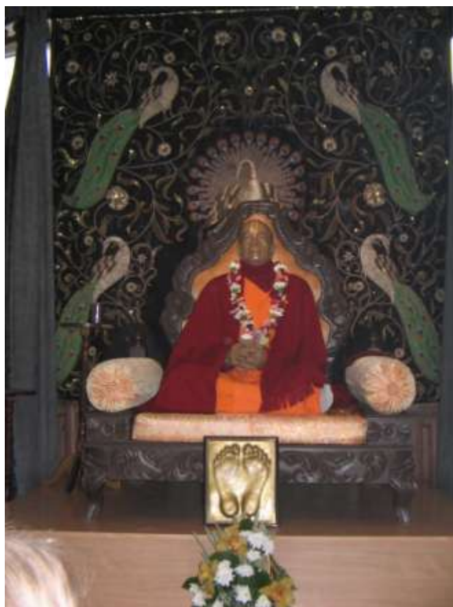
Фотоснимок 1. Статуя Свами Бхактиведанты Прабхупады в храме Общества Сознания Кришны в Риге. (Ноябрь 2007 г.) 27