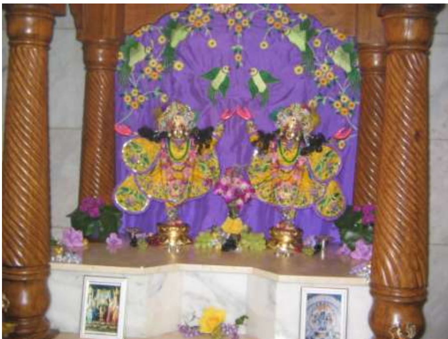
Фотоснимок 1. Алтарь храма Общества Сознания Кришны в Риге со статуями Чайтаньи и Нитьяланды в центре. 39

Бога в вайшнавизме изображают по разному. Просто запутаться в большом разнообразии воплощений, экспансий и энергий Кришны. Так же пространен и спектр образов Кришны. Если Радхарамана воплощает и Кришну, и Радху, то в алтаре рижского храма можно лицезреть Кришну в образе Чайтаньи и Нитьяланды. (См. фотоснимок 1.) В соответствии с пуранической мифологией Кришне в Его подвигах помогал его единокровный брат Баларама. Судя по всему потому, что Баларама является кровным родственником Кришны, их можно почитать за одно. Чайтанья в бенгальском вайшнавизме считается воплощением Кришны и Радхи, а его соратник Нитьянанда – инкарнацией Баларамы.