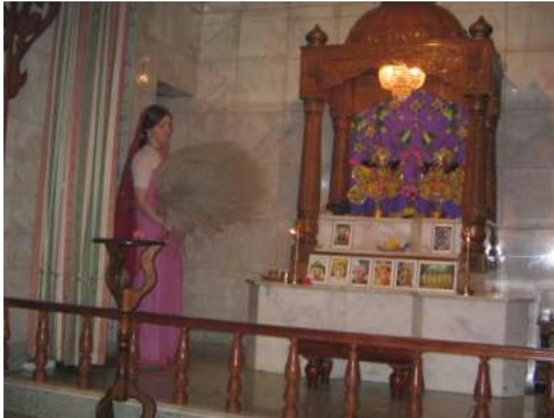
Фотоснимок 2. Служение статуям (здесь посредством веера).

посетителей-европейцев, для тех представителей западной культуры, которые находятся в поиске эмоционально наполненной и к человеческим реалиям близкой религиозности, служение мурти приходится по сердцу. Выражаясь академическим языком, крайняя имманентность арчаватары , ее осязаемость и незамысловатая форма служения ей является средством антропологизации абстрактных богословских категорий, столь востребованной ныне в Америке и Европе.