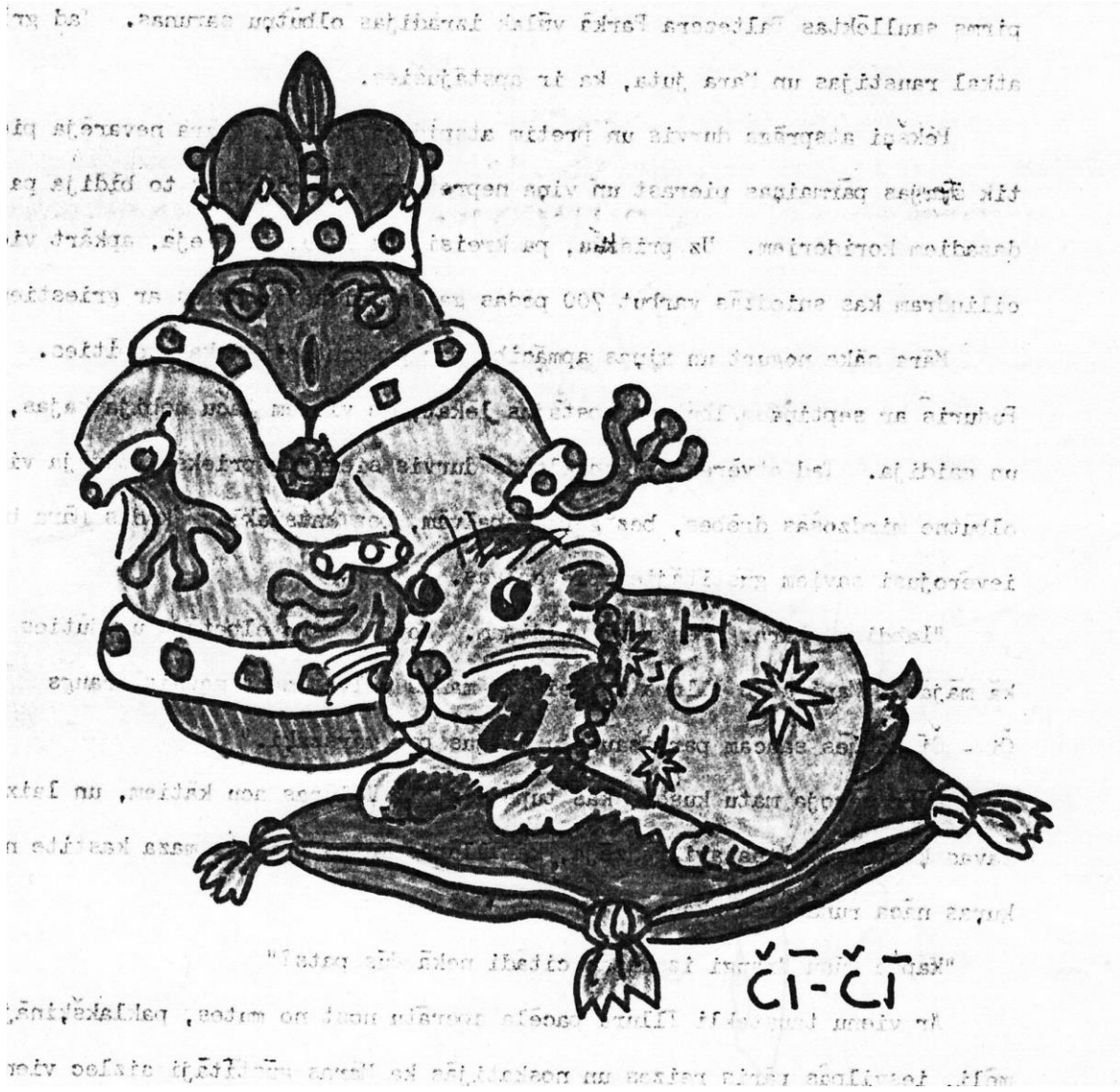
Olbūtnu Kēniņš ar Čī Čī