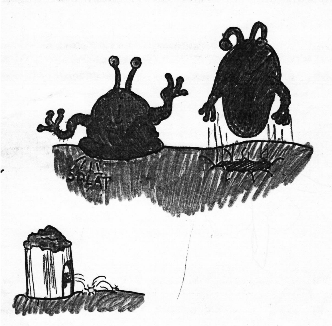
Olbūtnes un lifts lejā uz pazemi.