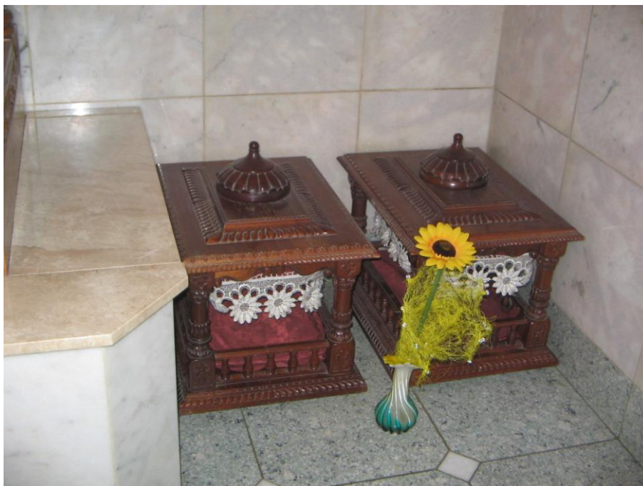
Fotoattēls nr. 6. Altāra telpā novietotās Čaitanjas un Nitjanandas gultiņas

Par labu tam, ka mūrī ir izteikti imanents raksturs, var īpaši atzīmēt mūsdienu Rietumu vaišnavisma sakrālās mākslas īpatnības. Tā nepieturas pie kādiem ikonogrāfiskiem kanoniem un ir krasi naturālistiska. Ikonogrāfiskie kanoni, savukārt, ir parasti saistīti ar zināmu simbolu izmantošanu. Jo naturālistiskāks stils, jo mazāk ir simbolu. Pareizticīgo kristīgā ikona ir apveltīta ar striktu simboliku