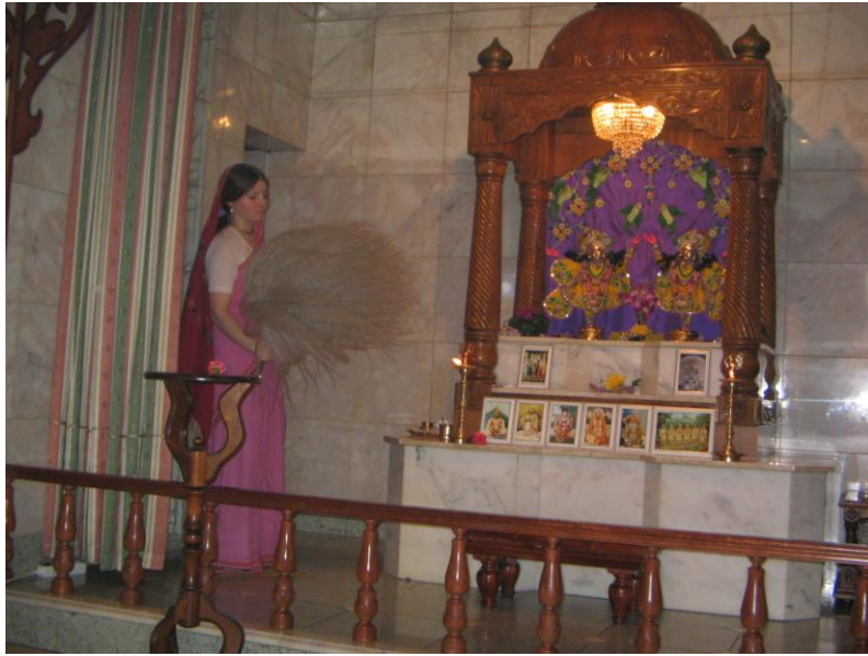
Fotoattēls nr. 5. Kalpošana statujām (šeit: izmantojot vēdekli)