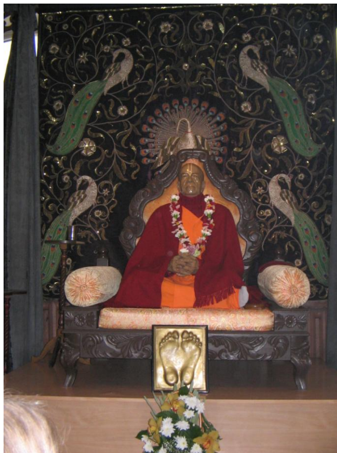
Fotoattēls nr.1. Svāmi Bhaktivedantas Prabhupādas statuļa Rīgas Krišnas Apziņas templī. Uzņemts 2007.g. novembrī

Attiecībā uz grēka un grēka deldēšanas tēmu var secināt, ka kļūstot par vaišnavu, rietumnieks nav zaudētājs, bet ieguvējs. Atbrīvojies no samaitātās būtnes statusa, viņš uzkrāj personīgi pastrādāto grēku uz skolotāja pleciem. Kristus kā Dieva Jēra jeb pasaules grēku nesēja vietā stājas guru . Krišnas Apziņas piekritēji īpaši godina Prabhupādu (sk. fotoattēlus nr. 1 un 2.) un citus skolotājus attēla veidā, kas aizstāj Kristus pielūgšanu kristietībā. Un, ja kristietībā Kristus apvieno transcendentā Dieva un Atpircēja lomas, tad Krišnas Apziņā tās ir viena no otras nodalītas. Krišna pārstāv transcendentu dievišķo jomu, bet skolotājs deldē grēkus.