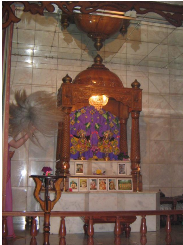
Fotoattēls nr. 3. Altāris Rīgas Krišnas Apziņas tempļī ar Čaitanjas un Nitjanandas statujām centrā. Zem statujām ir skolotāju fotogrāfijas. Uzņemts 2007.g. novembrī

Dievu vaišnavismā mēdz attēlot dažādi. Ir viegli apmaldīties Kunga inkarnācijās, ekspansijās un enerģijās. Tik pat plašs ir Krišnas veidolu spektrs. Ja Rādharāmana arcā iemieso gan Krišnu, gan Radhu, tad Rīgas Krišnas Apziņas biedrības tempļa altārī var skatīt Krišnu Čaitanjas un Nitjanandas tēlā (sk. fotoattēlus nr. 3. un 4.). Saskaņā ar purānisko mitoloģiju Krišnam viņa dižajos darbos palīdzēja viņa miesīgais brālis Balarāma. Bet sakarā ar to, ka Balarāma ir brālis, tad Krišna un Balarāma ir viens. Čaitanja Bengālijas vaišnavismā ir uzskatāms par Krišnas un Rādhas iemiesojumu, bet Čaitanjas sabiedrotais Nitjananda – par Balarāmas inkarnāciju.