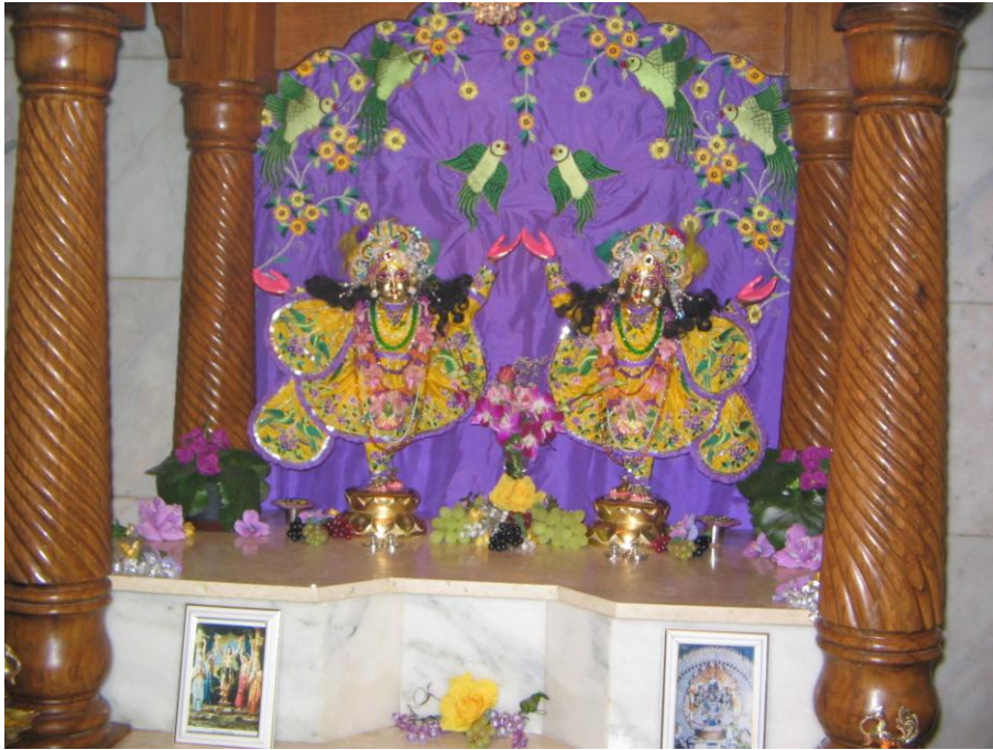
Fotoattēls nr. 4. Čaitanjas un Nitjanandas statujas tuvplānā

Bhaktivedanta Manor templī Anglijā altāris ir it kā sadalīts divās daļās. Vienā pusē atrodas Rādhas un Gokulānandas (Krišnas) statujas, kuru pakājē atrodas izmērā mazākas Čaitanjas un Nitjanandas statujas. Tas, ka tās ir mazākas un ir novietotas zemāk, norāda uz tēlu hierarhiju. Inkarnācijas ir zemākas par Kunga pirmatnējo tēlu. Otrajā altāra pusē atrodas rindā stāvošas Sītas, Rāmas un Lakšmana-Hanumāna statujas. Sīta, Rāma un viņa palīgs Hanumāns (dievs pērtiķa izskatā) ir slavenā eposa Rāmājāna varoņi. Tas, ka Rādha-Gokulānanda un Sītā-Rāma-Lakšmana-Hanumāns atrodas divās altāra pusēs, bet vienā līmenī, nozīmē tēlu pulciņu vienlīdzību no vienas puses un to viena otru papildinošās funkcijas. Sītā-Rāma-Lakšmana-Hanumāns ir atbildīgi par dharma s jeb pasaules kārtības uzturēšanu, kamēr Rādha-Gokulānanda iemieso dievišķo mīlestību uz radību. 38 Ir jāpiebilst, ka statuju daudzveidība nav neizprotama bijušajam kristietim, jo priekšstats par Dievu trijās Personās ir doktrināra Bhagavāna modu daudzveidības paralēle.